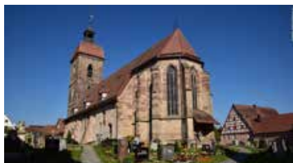
St. Laurentius in Rosstal

Die Kosten für Busfahrt und Führungen betragen 30 €.